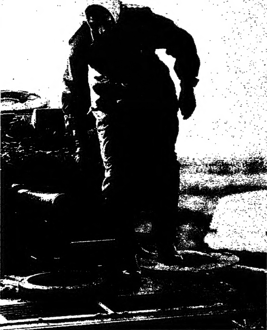
الاميرة ان تهيظ من دجلة شيطان، بعد اجتيازها معمودية النار